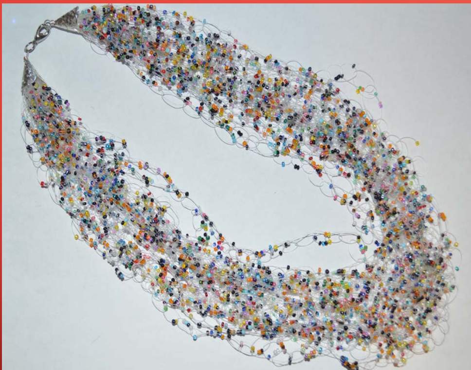
Воздушка «Бисерная россыпь»