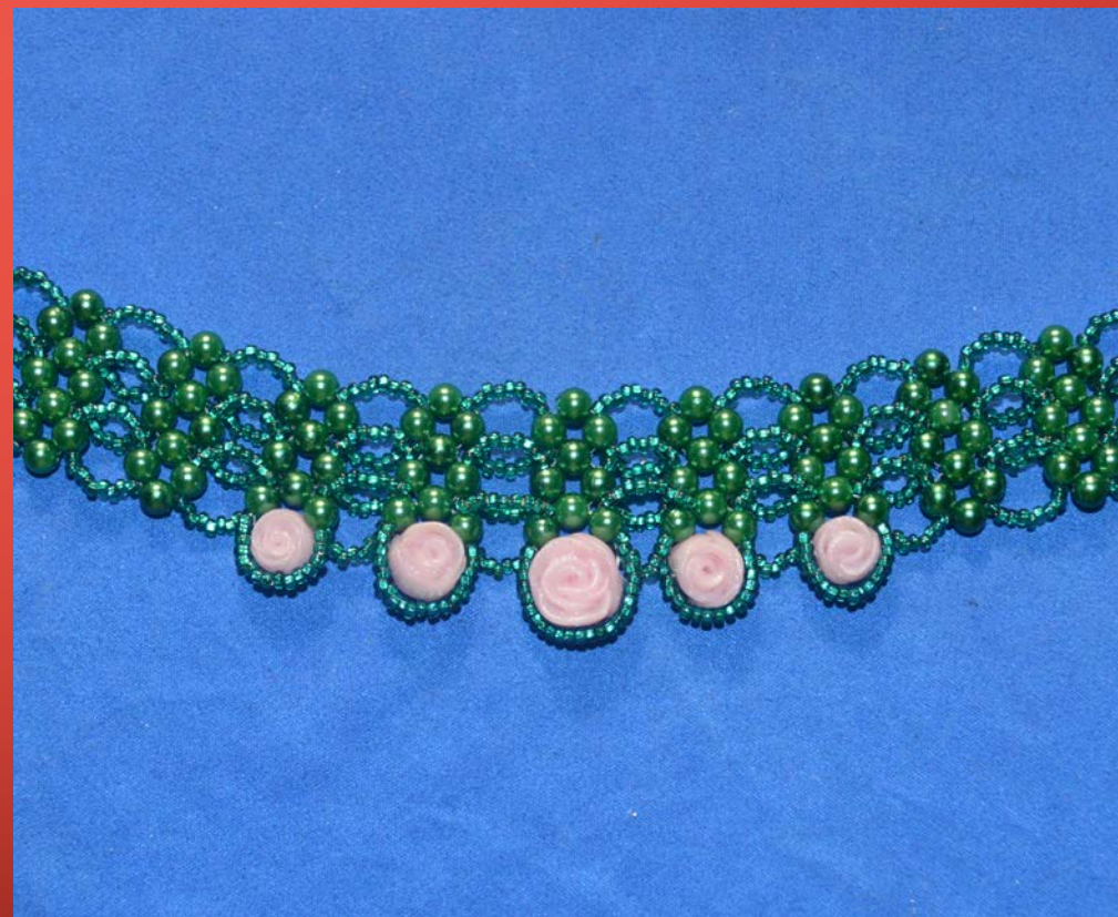
Колье-стойка «Розовый сад»