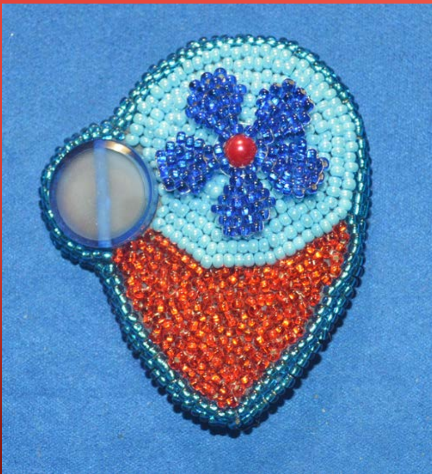
Брошь «Не каменное сердце»