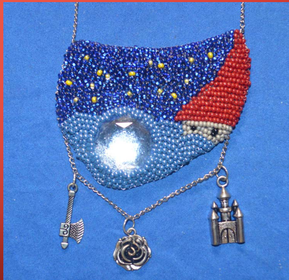
Кулон «Замок мой»