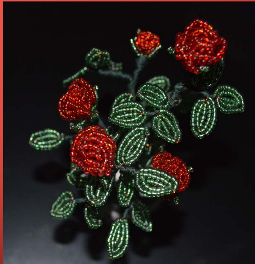
Горшочек с розами