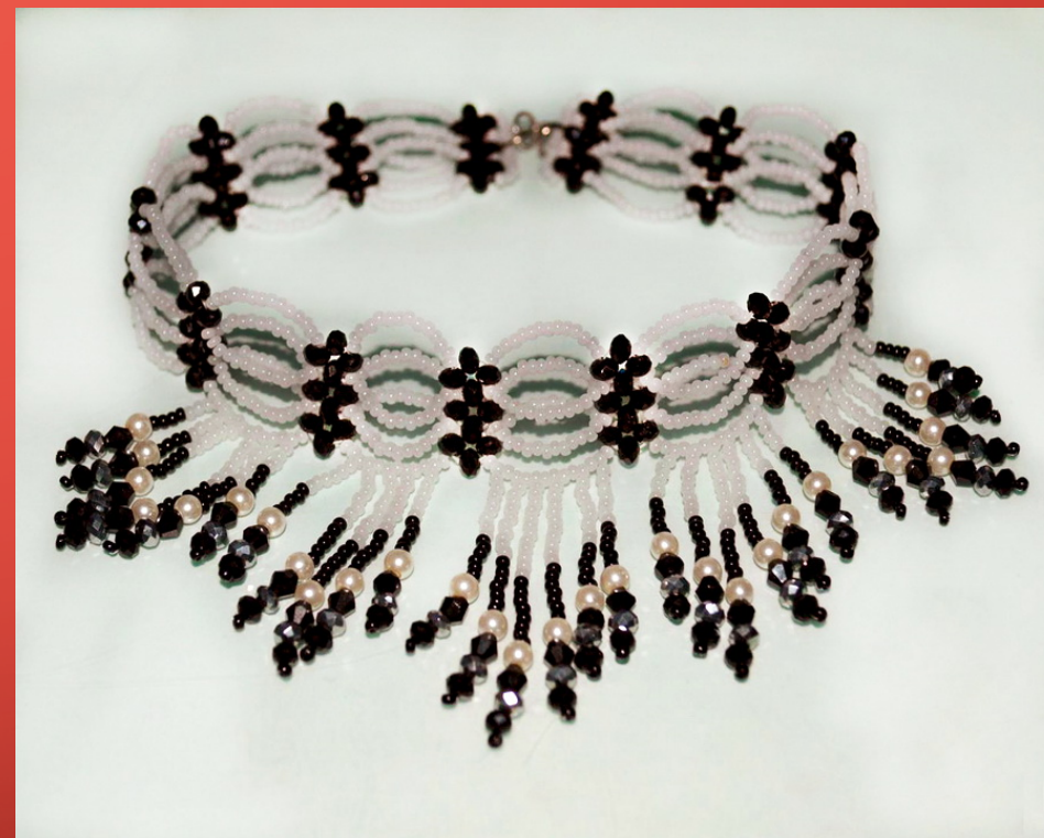
Колье-стойка «Чёрно-белый павлин»