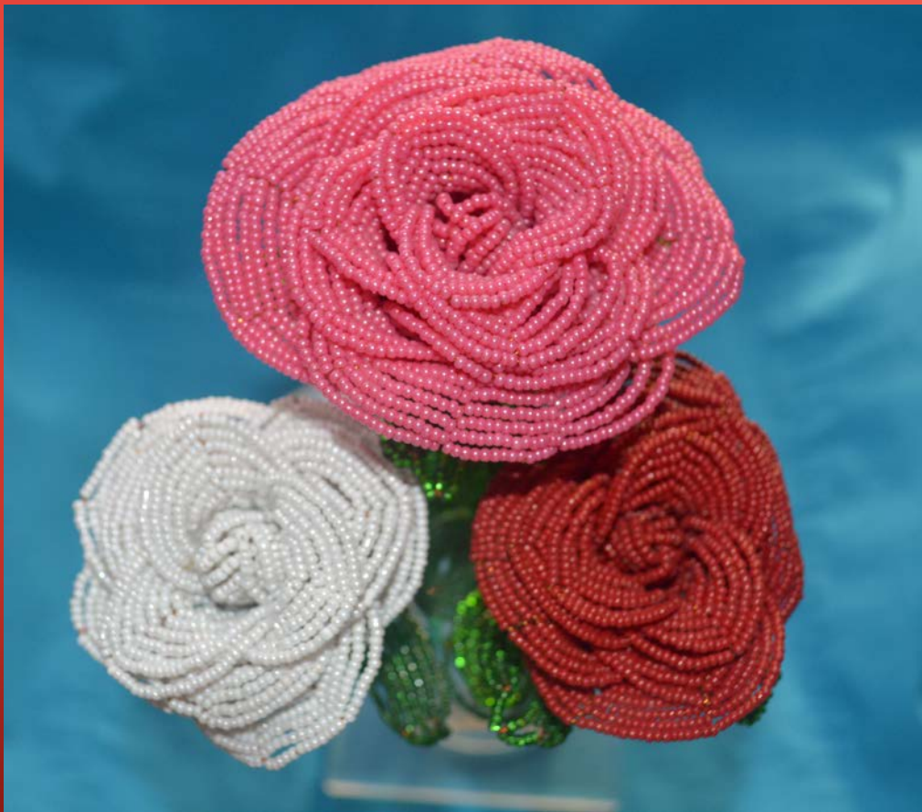
Композиция «Цветы истории»