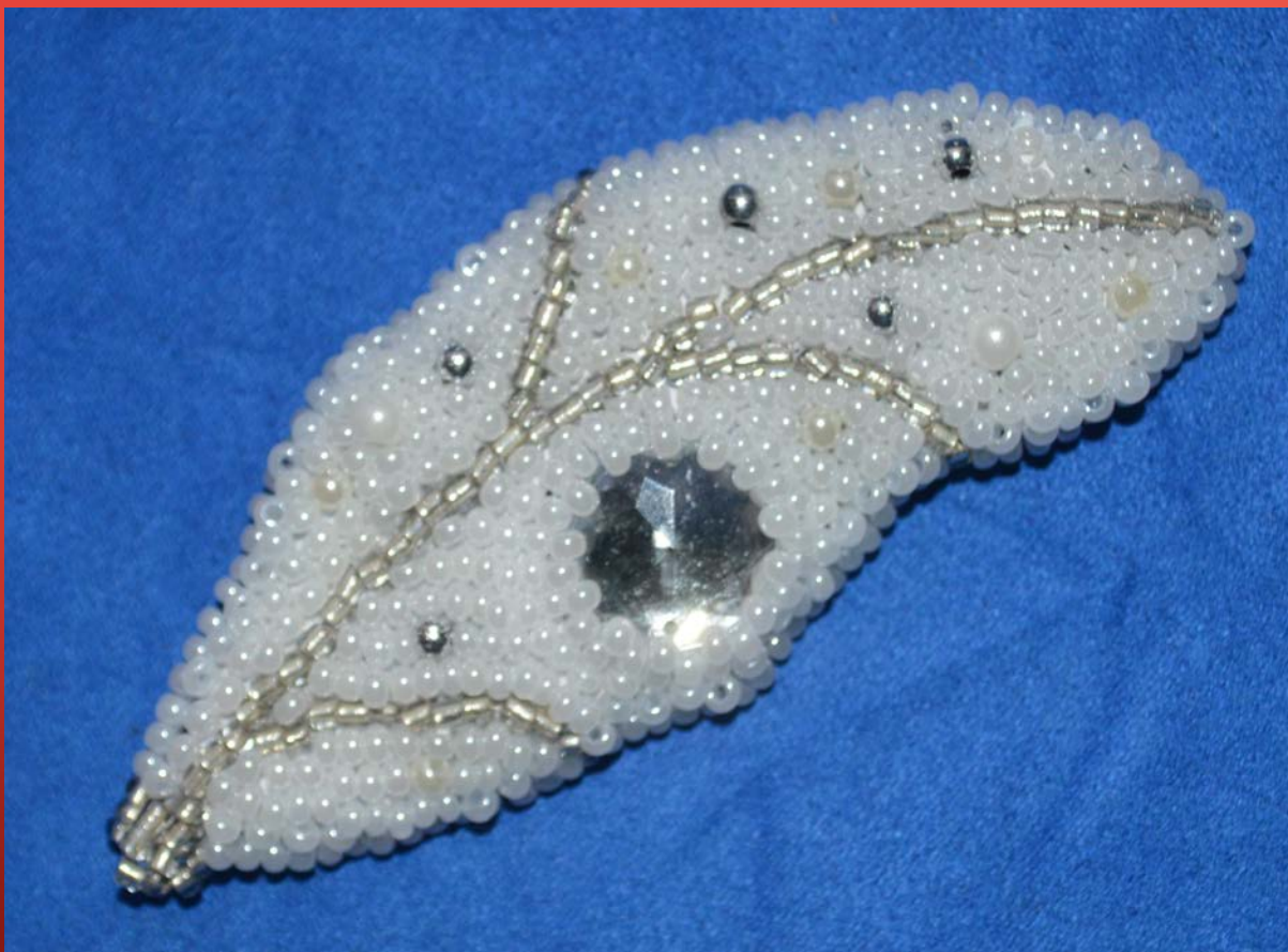
Брошь «Перо зимы»