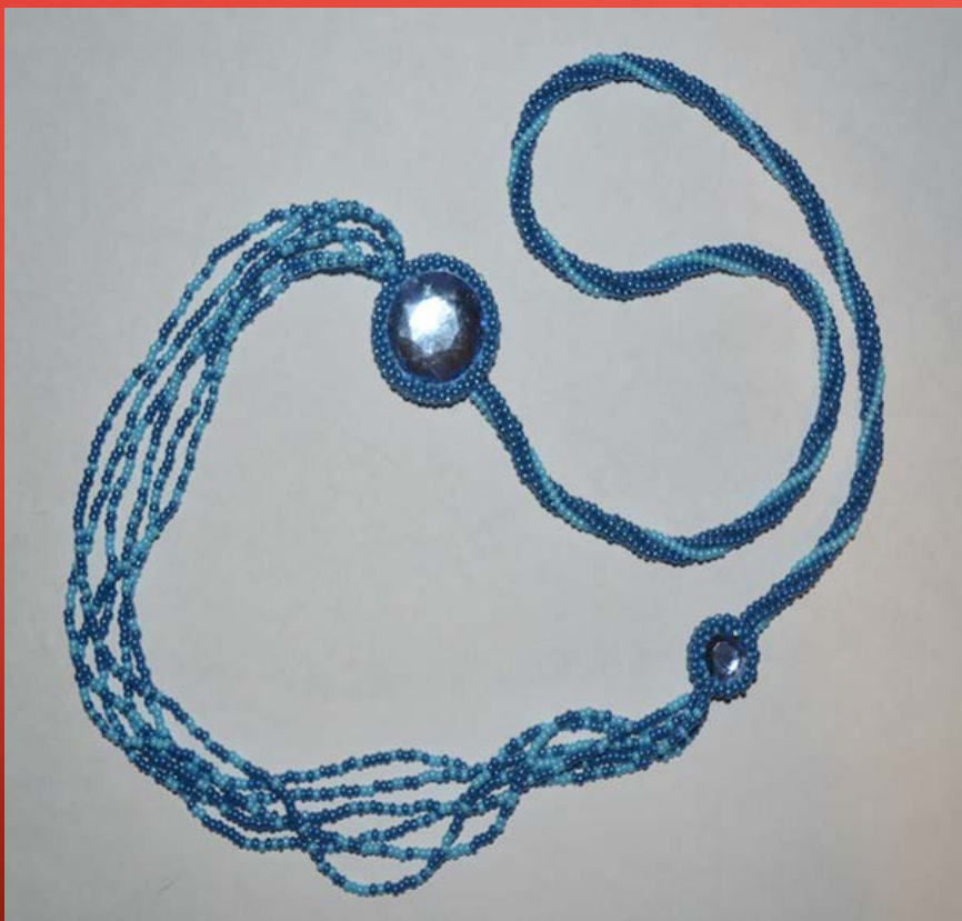
Колье «Осенний дождь»